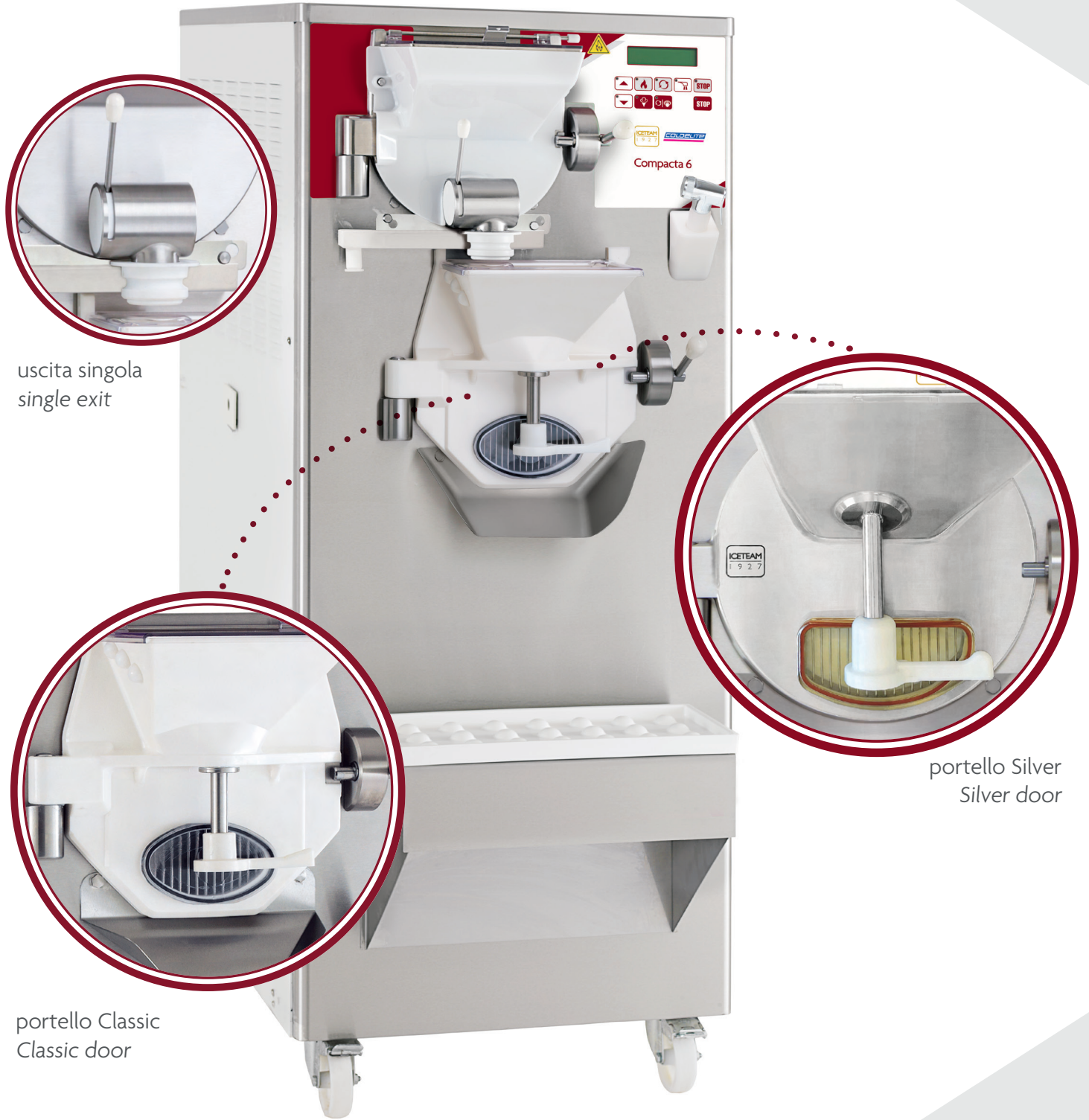
uscita singola single exit